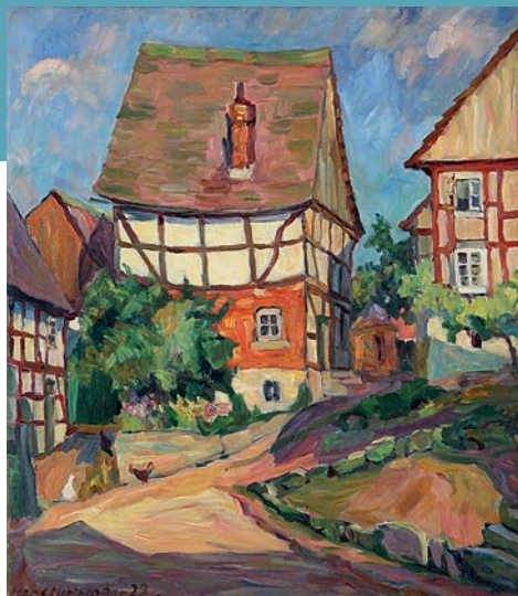
Hans Northmann (1883–1972), Die Tinne, Öl auf Lein- wand, 95 × 86 cm, 1928, Sammlung Städtische Galerie Schwalenberg, Foto: U. Heinemann