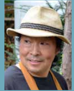
... Jaimun Kim Kombikurs