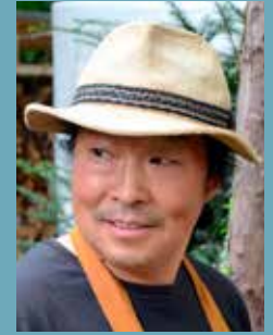
... Jaimun Kim Kombikurs